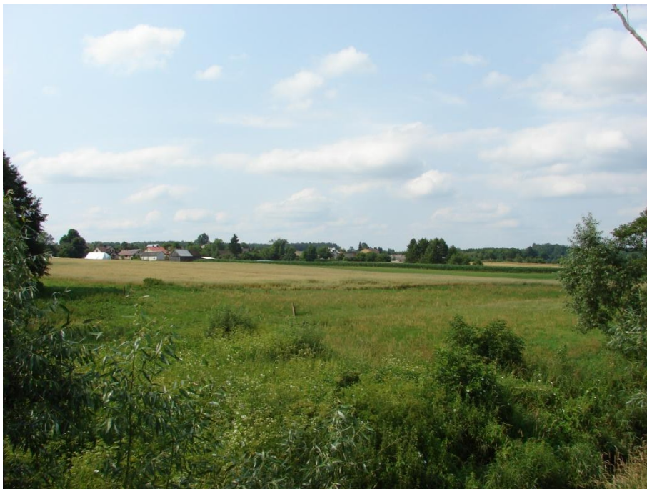
stanowisko od strony wschodniej

Posiada wartość historyczną i naukową do badań i poznania osadnictwa słowiańskiego na tym terenie.